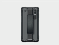
Funda de protección de TPU