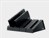
Base de Carga