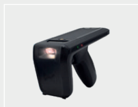
Pistola lector IRF-50