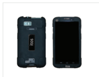
Funda de Silicón