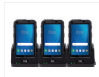
Base de Carga Múltiple