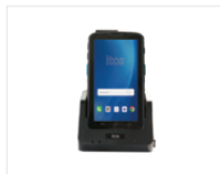
Base de Carga