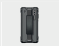
Funda para CM5-X