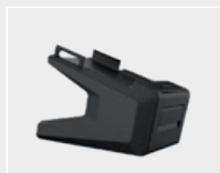
Estación Multifuncional para CM5-X