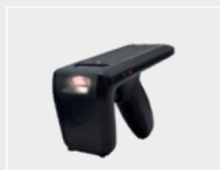
Pistola lector IRF-50