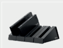
Base de Carga para CM5-X